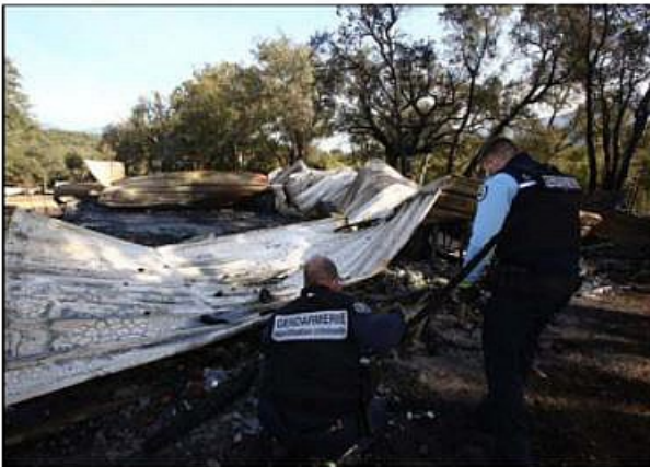
L'incendie a endommagé le club house et la sellerie du club.